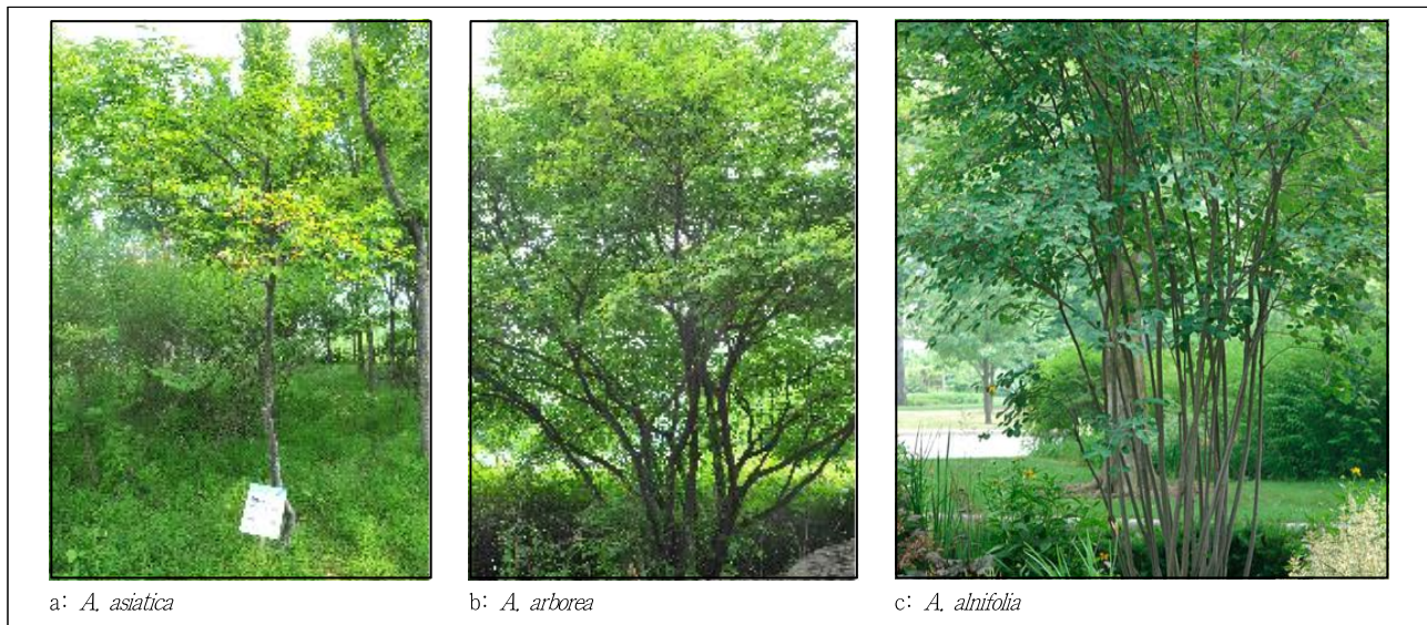
Figure 1. Comparison of tree form between Korean native A. asiatica , A. arborea , and A. alnifolia in 2015