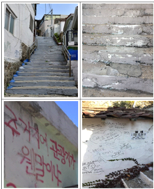
Figure 1. States of murals in Ewha-dong

연구조사 기간은 2018년 6월 1일부터 약 2주간 공휴일을 포함한 평일과 주말, 이화동 벽화마을 내 주민들을 대상으로 총 30부 실시하였다. 설문조사 시 설문조사원들에게 설문조사방법을 숙지시킨 후, 주민을 대상으로 연구목적 전달을 위해 설문지의 충분한 이해가 이루어지도록 설명하였고, 준비된 설문지에 맞춰 설문지에 직접 응답하는 자기기입방식으로 이루어졌으나, 일부 노인계층의 경우 설문조사원이 설문내용을 읽어준 후 응답자의 대답에 따라 조사원이 직접 작성하는 자기기입방식을 병행하였다. 추가적으로 이화동 벽화마을 내 심층적인 문제를