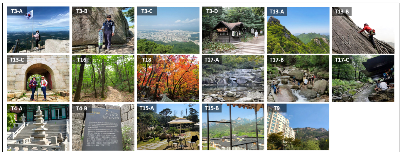
Figure 3. Examples of resource and activity images by cultural ecosystem services indicators in urban forest