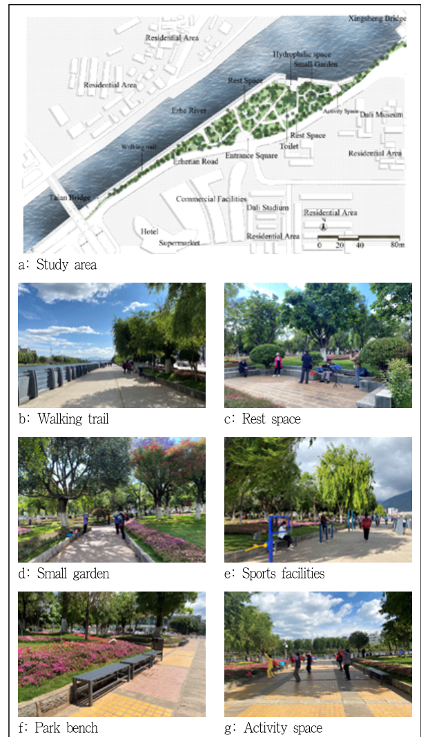
Figure 1. Study area and current status

설문지의 구성을 살펴보면, 인구통계학적 특성은 응답자의 연령, 성별, 직업, 교육, 동거 형태 등에 관한 문항을 포함하였다. 공원의 이용 목적 및 행태에는 이용 목적 및 빈도, 이용 시간대 및 체류 시간, 이용 수단 및 접근 거리 등을 포함하고 있다. 다음으로 공원 환경요소의 중요도 및 만족도에 관한 항목은 선행연구 고찰에 의한 17개의 항목으로 구성하였다(Table 2