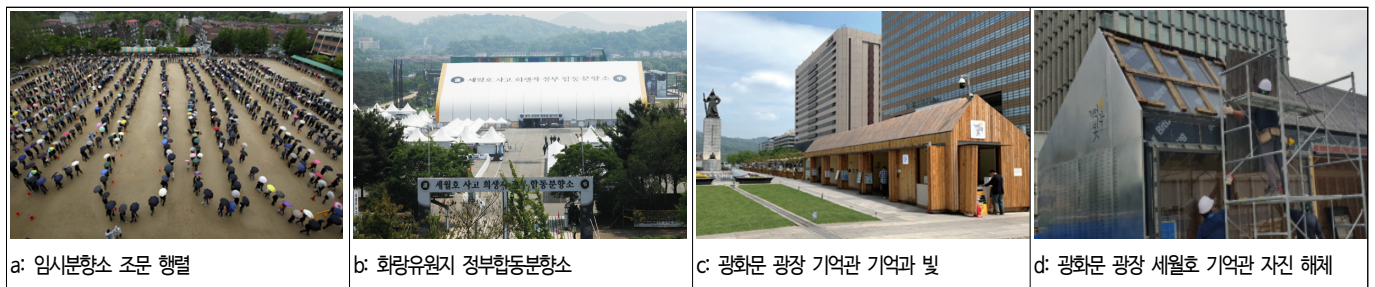
그림 5. 장소의 소멸 현장(정부합동분향소와 광화문 광장)

모두가 공감하는 사회적 기억이 되는 과정에서는 기억과 망각이 경합하는 과정을 겪게 된다(김민환, 2019). 이는 과거 발생했던 사건이 사회적으로 합의되지 않은 상황에서 현재를 살아가는 이들에게 계승되고 지속할 것인가를 결정하는 과정이다. 이는 우리가 살아가는 삶의 현장 어느 곳에서나 발생하며 지역사회 분위기, 개인과 집단이 가진 이념 등에 따라 다양한 양상으로 나타난다. 그간 우리 사회는 기억하기보다 망각하는 가치를 우선시했고, 그것은 본래의 장소성을 반영하지 못하는 결과를 만들었다. 이러한 상황적 어려움을 잘 인지하고, 세월호 참사 치유적 장소 전개 양상을 살펴보는 것이 필요하다. 치유적 장소의 소멸은 불편한 감정을 지우고 싶은 마음에서 시작된다. 죽음의 공간이 가까이 있으므로 인해 발생하는 두려움과 슬픈 기억은 일상생활에 어려움을 준다(김현희와 이인규, 2011). 따라서 일부 시민은 세월호 희생자를 애도하는 공간은 일시적으로 조성되는 것이지, 장기간 존재하는 것은 동의할 수 없다고 했다. 그리고 어느 순간 세월호 참사 관련 장소가 정치적 이념논쟁을 유발하는 공간이라는 부정적 인식이 형성됐다(진예린, 2020). 세월호 참사 유가족 및 시민사회의 투쟁과 저항의 이미지가 강하게 드러워지면서 정치적 성향 차이에 따른 이념논쟁이 발생했고 사회운동을 지원하는 공간이라는 인식이 강하게 형성됐다. 이러한 현상은 의도적인 왜곡과 잘못된 정보 전달로 인한 오해와 불신 감정일 수 있지만, 결과적으로 치유적 장소가 사라지게 되는 원인이 되었다. 이러한 이유로 시간이 흐르면서 점차 장소는 사라지게 되는 것이다. 본 연구에서는 이와 같이 치유적 장소가 소멸하는 양상을 정부합동분향소와 광화문 광장을 중심으로 ‘결속형 집단 갈등과 의견충돌’과 ‘정치적 이념 논쟁과 가치대립’으로 구분하여 살펴보았다(그림 5 참조).