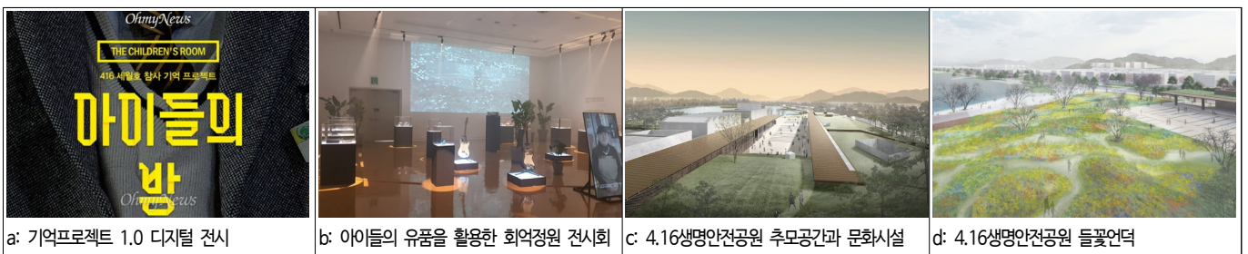
그림 6. 장소의 변용 현장(아이들의 방과 4.16생명안전공원)

다음은 대안적 추모를 위한 영속적 공간 활용이다. 한국 사회는 삶과 죽음, 일상과 추모를 엄격하게 구분하고 있어 죽은 자에 대한 기억을 의례화하고 추모의 공간을 일상과 격리하는 문화를 가지고 있다(김성호, 2021). 따라서 추모 공간을 조성하고 운영하는 것은 일상과 어울리는 것이 쉽지 않다. 따라서 세월호 참사 치유적 장소에 대한 인식의 전환을 통한 대안적 추모 방안 마련이 필요했다. 유가족들과 전문가들은 추모와 애도 공간의 개념을 다시 설정하고, 치유적 장소의 기능 및 역할도 새롭게 부여했다. 대안적 추모에서 중요하게 생각되는 가치는 일상에서의