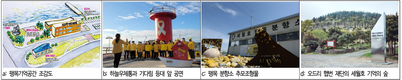
그림 3. 영구적 장소의 생산 현장(진도군 팽목항)

구조를 기다렸던 곳이다. 이곳은 실제 참사가 발생한 현장은 아니지만, 당시 언론 보도에 반복적으로 노출되면서 국민에게 세월호 침몰과 직접적으로 연관된 장소 이미지를 각인시켰다. 사고 수습이 완료된 이후 유가족들과 방문객이 머무는 공간은 팽목지역관이 되었고, 지금까지 기억캠프, 순례길, 문화예술마당 등 행사가 진행되고 있다. 그리고 붉은 등대, 바람에 날리는 노란 리본, 하늘나라 우체통도 언론에 많이 등장한 장소들인데, 이곳을 방문하는 시민들이 추모와 애도의 마음을 담고 있다. 기억의 벽은 참사 이후 줄어든 추모객을 아쉬워하며 시민과 작가들이 방파제에 만든 치유적 장소이다. 현장의 가슴 아픈 기억을 희망으로 승화시켜 희생된 이들을 잊지 않고 기억하기를 바라는 마음이 담겨 있다. 팽목항 인근에는 오드리 햅번 어린이 재단, 사회적 기업 트리플레넷, 국민 후원으로 만들어진 세월호 기억의 숲이 있다. 추모의 마음을 담아 은행나무 306그루를 심고, 건축가의 재능기부로 기억의 벽이 조성되었다. 이러한 과정을 통해 시민들의 공감과 응원의 마음을 전하는 치유적 장소가 되었다.