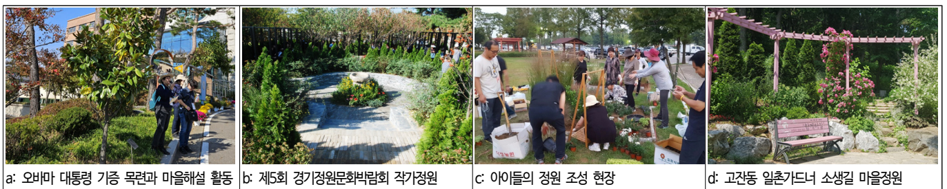
그림 4. 일시적 장소의 생산 현장(안산시 화랑유원지와 고잔동 마을)

일시적 장소 활용은 비물리적 형태로 구현되는 활동 방식이다. 헌화 분향, 집회 시위, 추모 의례, 문화축제, 교류 행사 등이 사회적 애도가 이에 해당한다. 아이들의 일상적 생활 공간이었던 단원고와 고잔동 마을, 화랑유원지에서는 떠난 아이들을 기억하기 위한 일시적 장소 활용을 위한 활동이 이루어졌다(그림 4 참조). 유해정(2018)에 따르면 애도는 죽음이라는 회복 불가능한 상실에 대한 남은 자들의 응답이라고 했다. 떠나보낸 슬픔을 주체하지 못하고 눈물을 흘리며, 고귀한 희생이 헛되지 않도록 사회적 책무를 다하는 행동인 것이다. 그리고 이러한 과정은 산 자와 죽은 자가 연대하는 활동이기도 하다. 삶과 죽음의 경계로 단절되는 것이 아니라 정신 속에서 함께 공존하며, 이전의 관계에서 다른 관계로 확장 변화하는 것이다. 세월호 참사 이후의 사회적 애도는 일시적으로 장소를 생성하거나, 기존 공간에 의미를 부여하는 상징성을 확산하는 형태로 진행됐다. 특히 단원고 교실은 마음을 전하고자 했던 시민들의 일시적 애도의 공감장(共感場) 4) 으로 활용됐다. 이 곳은 희생된 이들이 많은 시간을 보내며, 친구들과 꿈을 키우던 곳이다. 따라서 남아 있는 이들이 아이들의 일상을 상기하며 상실의 고통을 애도로 승화시키며 치유적 장소를 형성한 것이다. 개인적으로는 답답한 생각을 표출하며 응어리진 감정을 해소하고, 사회적으로는 대중적 참여를 형성하여 변화를 만드는 동력이 됐다. 학교에 남아 있던 재학생들이 먼저 돌아오지 않는 이들을 기다리는 마음으로 책상에 꽃과 사진, 편지 등을 남겼고, 그 이후 전 국민이 이곳을 방문하여 사회적 애도를 표했다. 이와 같은 분위기 속에 당시 한국을 방문한 오바마 대통령은 단원고 교정에 목련 묘목을 기증했다. 실의에 빠진 유가족들의 아픔에 공감하고, 희생된 아이들을 기억하기 위한 마음도 함께 전했다. 백악관에도 심겨 있는 이 나무는 책스 목련이라고도 불리며 사랑하는 사람을 그리워하는 이에게 위로를 주는 부활의 상징으로 알려져 있다 5) . 그 이후 오바마 목련 작은 정원이 조성되었고 단원고를 방문하는 이들에게 그 의미가 전해지고 있다.