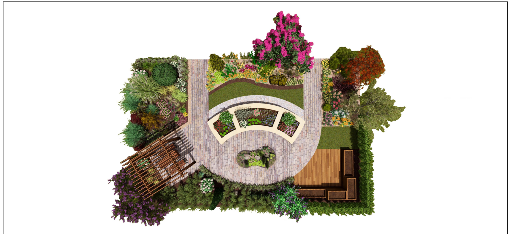
그림 1. 치유정원 모델 마스터 플랜 자료: 국립수목원(2024)

자료: 김소희(2004); 국립수목원(2024); 윤주영 등(2025)을 바탕으로 재구성