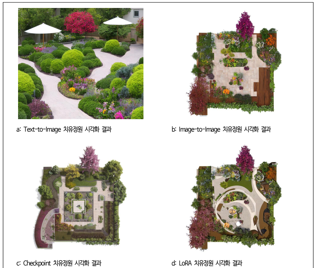
그림 4. Stable Diffusion 모듈별 치유정원 시각화 결과

본 연구에서는 국립수목원(2024)의 모델정원 기본 이미지를 입력 자료로 활용하여 Image-to-Image 기능으로 치유정원 시각화를 수행하였다. 생성된 결과물은 심미성과 기능 측면에서 다음과 같이 평가되었다(그림 4 참조). 첫째, 심미성 측면에서 중앙부 곡선형 식재대와 주변부의 목재 데크, 다양한 초화류와 관목이 명확히 배치되어 공간의 위계와 조형성이 뚜렷하게 드러났다. 계절감이 있는 식재와 색채 대비가 확보되었고, 상·하부 식재의 층위가 조화를 이루었다. 그러나 일부 공간에서는 특정 식물 질감이 반복적으로 표현되어 단조로움이 발생했으며, 시설물의 디테일과 보행자 스케일감이 충분히 반영되지 않았다. 둘째, 기능적 측면에서 순환형 S자 동선이 명확히 드러나