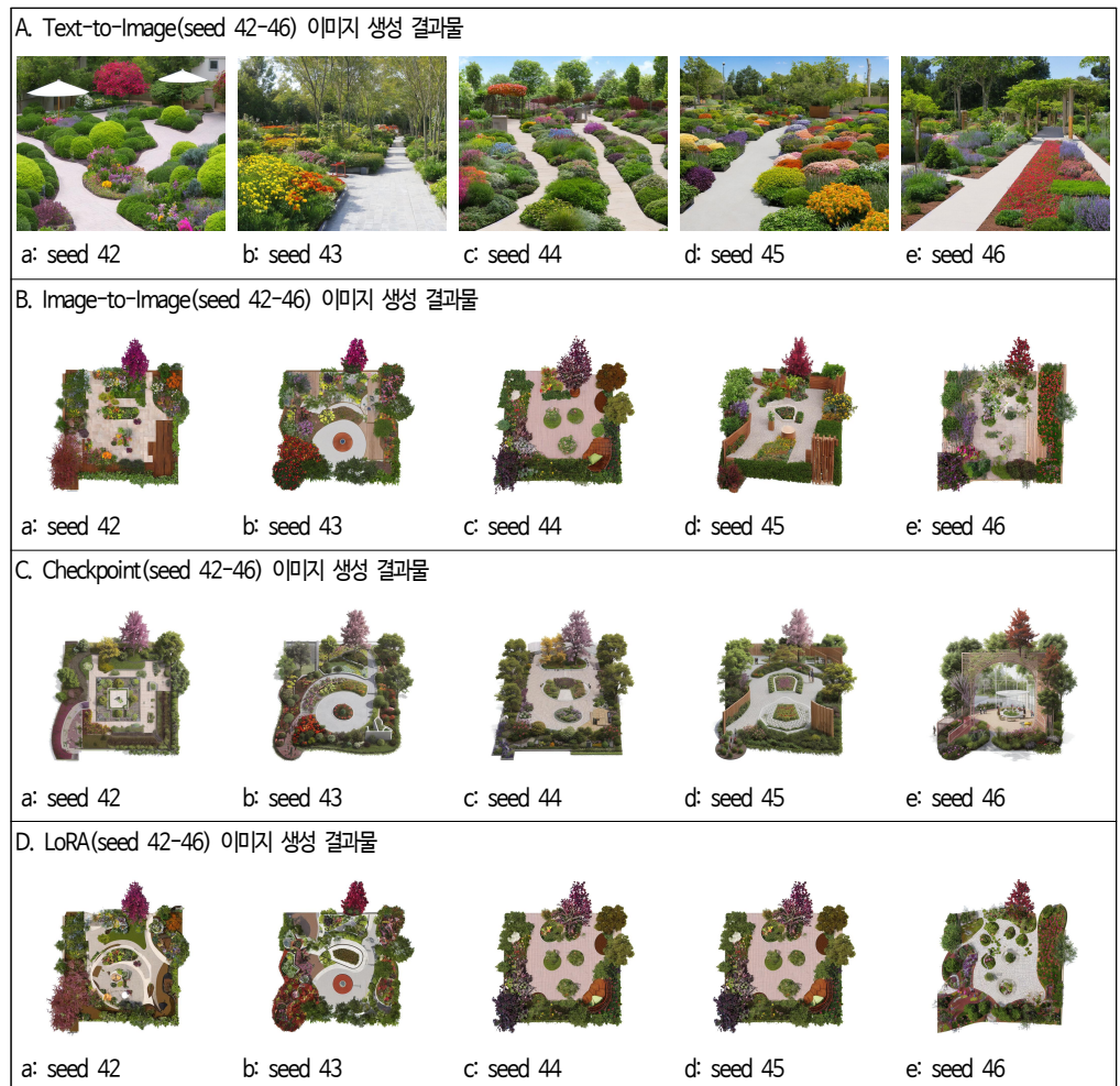
그림 3. Stable Diffusion 모듈별 치유정원 시각화 결과

본 연구에서는 OpenAI의 CLIP ViT-B/32 모델을 사용하여 이미지·텍스트 임베딩을 L2 정규화하고, 코사인 유사도를 기반으로 CLIP Score를 산출하였다. 이미지 생성은 동일한 프롬프트와 조건(CFG = 7.5, steps = 35, 832 × 704, sampler: DPM++ 2M Karras, Image-to-Image의 경우 denoising = 0.6)에서 수행하였다. 각 기능(Text-to-Image, Image-to-Image, Checkpoint, LoRA)은 시드 42-46 범위로 5회 반복 생성하여 평균 ± 표준편차(Mean ± SD)를 산출하고 비교하였다. 반복 생성 결과 이미지는 다음과 같다(그림 3 참조).