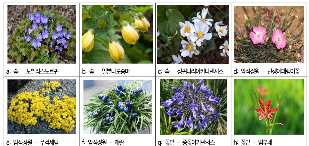
그림 5. 숲, 암석정원, 꽃밭의 애호가용 추천 식물 예시

한젠이 정원 서식처 유형을 자연환경이 우세한 숲, 숲 가장자리, 개방지, 물가, 물과 인공적으로 조성되는 암석정원, 꽃밭을 제시함으로써 정원으로 수용가능한 다양한 경관을 포괄했다. 그가 설정한 서식처별 개념 이미지를 통해서 우리의 보편적 관념과 차별화된 이해가 가능하다. 7가지 정원 서식처 기반 여러해살이풀의 분류 특성을 도출한 결과,