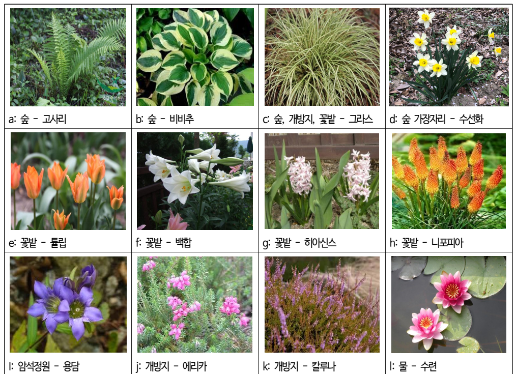
그림 4. 정원 서식처별 분류 항목명으로 사용된 식물

한젠은 예외적 의미의 '특수 지역(special sites)'을 분류 항목으로 설정하고 하위에 '특수 조건(special conditions)'을 명시하여 적합한 식물을 제시하였다. 숲 서식처의 중분류 항목인 '그늘과 반그늘의 특수 지역(1.3)'은 나머지 중분류 두 개에 '그늘과 약한 그늘'이라고 동일하게 명명한 것으로 볼 때, '그늘과 반그늘'은 숲 서식처에서 특수한 환경이라고 이해한 것이며, 하위 소분류에 '서늘하고 부분적으로 그늘지며 대체로 축축하고 습한 지역(1.3.1)'과 같이 간략하게 설명하기 어려운 복잡한 환경, '더 까다로운 여러해살이풀을 위한 특수 조건(1.3.3)', '열정적인 식물 애호가들을 위한 여러해살이풀(1.3.2)'이 있다. 숲 가장자리 서식처에도 '특수 조건'이 설정되었는데, '서늘하고 축축하며 양지 또는 약간 그늘진 곳(2.3.1)', '따뜻한 양지 또는 밝은 그늘의 모퉁이(2.3.2)', 그리고 '밝은 곳부터 그늘진 곳까지, 교목과 관목 아래에서도 자라는 적당한 여름 가뭄에 강한 여러해살이풀(2.3.3)', '양지의 숲 가장자리에서 여름 가뭄에 적합한 여러해살이풀(2.3.4)', '대형 공원과 정원에 적합한 키가 크고 강한 침입성의 여러해살이풀(2.3.5)'로 구성되었다. 이들 사이에서 맥락이 읽혀지지 않는데, 한젠의 경험에서 나온 환경 이해와 효용성을 고려한 설정이라는 것을 알 수 있다. 암석정원의 '특수 조건'은 '대형 암석정원에 적합한 아고산대 키 큰 초본(4.6.1)', '이